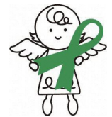
グリーンリボン キャンペーンの天使 ハーティ