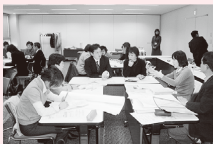
院内コーディネーター研修会の様子

臓器提供に関わるさまざまな観点から、院内整備を進めるモデル病院を県内3か所につくります。