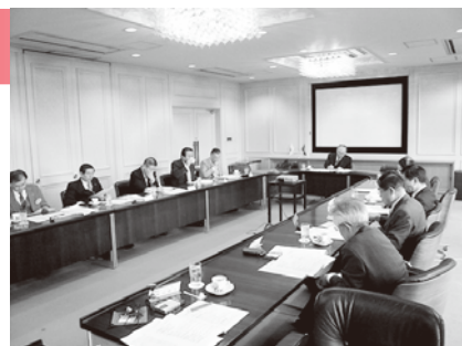
財団理事会の様子

(財)新潟県臓器移植推進財団では、県民の皆様に臓器移植医療をご理解いただくため、さまざまな取り組みをしております。昨年度は、県内市町村の開催する健康祭りに参加し、新潟県腎友会・新潟県移植者の会と協力しての臓器提供意思表示カードの配布などや、「臓器移植フォーラム in しばた」の開催など、多くの方々のご協力を得て臓器移植推進にまい進してまいりました。