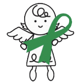
グリーンリボン キャンペーンの天使 ハーティ